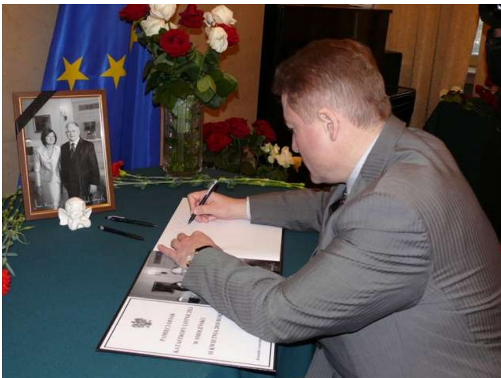
Gubernator Georgij Boos wpisuje się do księgi kondolencyjnej w Konsulacie Generalnym RP w Kaliningradzie.