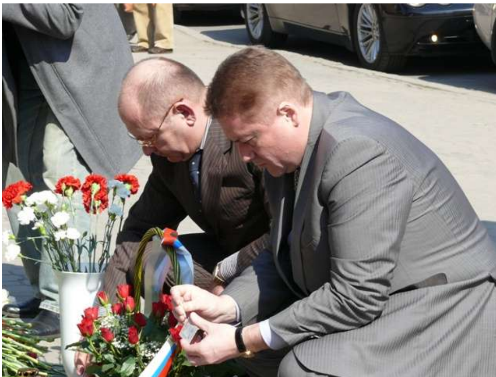
Georgij Boos gubernator obwodu kaliningradzkiego zapala znicz.